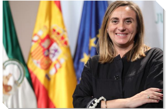
Dña. Marifrán Carazo Villalonga Consejera de Fomento, Infraestructuras y Ordenación del Territorio Junta de Andalucía

Presidenta del II Congreso Nacional de Movilidad