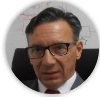
D. Davide de Sanctis OCTO TELEMATICS