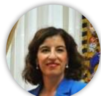
Dña. Aida Vilaret Cano Jefa Provincial JPT Málaga Dirección General de Tráfico. Ministerio del Interior