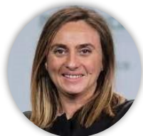
Dña. Marifrán Carazo Villalonga Consejera de Fomento, Infraestructuras y Ordenación del Territorio Junta de Andalucía

11.00 - 12.15 – S01: Apertura y Conferencia Inaugural