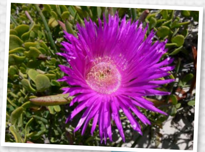
Flor de coitelo