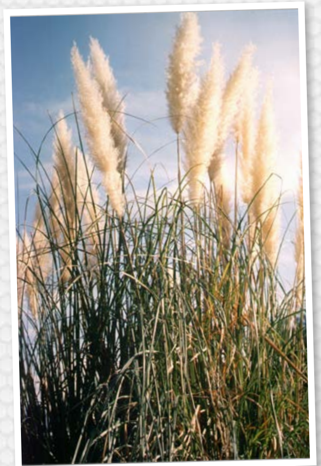
Herba da pampa