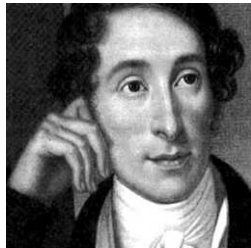
CARL MARIA VON WEBER

Compositor francés. Naceu en Metz, estudou no conservatorio de París e foi un neno prodixio. En 1832 gañou o Gran Premio de Roma. Durante tres anos estableceuse en Italia, e visitou Viena en 1836 antes de volver a París. Alí comezou a compoñer para Opéra Cómica e tamén para Opéra de París. A súa máis famosa ópera, de estilo melódico francés, foi Mignon , estreada no 1866. Escribiu 20 óperas, entre outras: A double échelle (1837), súa primeira ópera; o Carnaval de Venecia (1857), Hamlet (1868) e Francesca de Rimini (1882). É o autor da orquestación oficial da Marsellesa. Morreu en París.