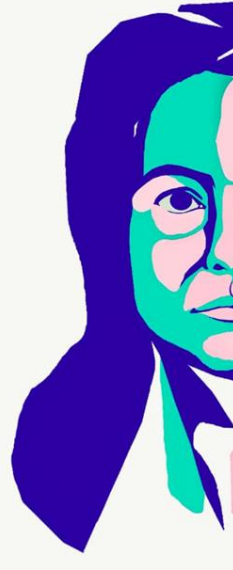
Deseño de Lorena Conde