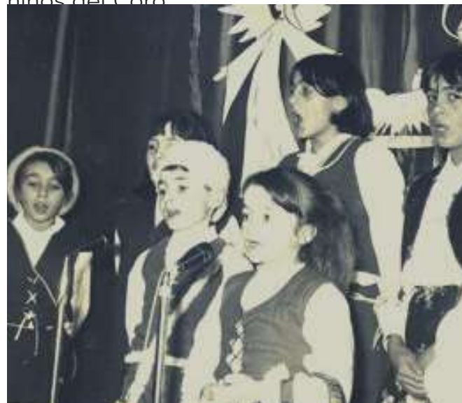
NENOS DO CORO DE SAN ROSENDO

A igrexa estaba onde esta hoxe o taller de pintura, fronte á biblioteca e o coro dos nenos, mesmo na esquina onde esta hoxe o Imperator e que ten a porta de cristal. O padre Emiliano ensinaba canto no coro infantil. Ían vestidos con túnicas e durante moitos anos cantaron nos actos litúrxicos. Pero tamén fixeron actuacións co nome artístico de "Los niños del Coro"