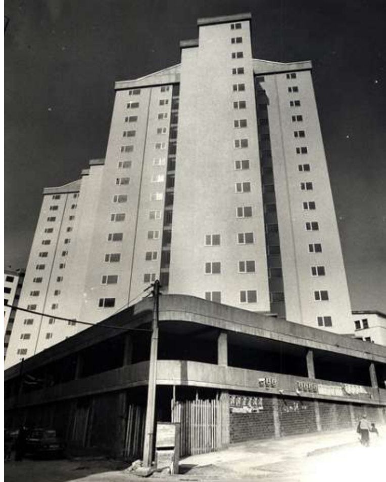
AS TORRES NOS ANOS DA SÚA CONSTRUCCION 1974

Era o lugar onde ían facer os traballos, buscar información, levar en préstamo libros e audiovisuais... Converteuse nun lugar de encontro e intercambio.