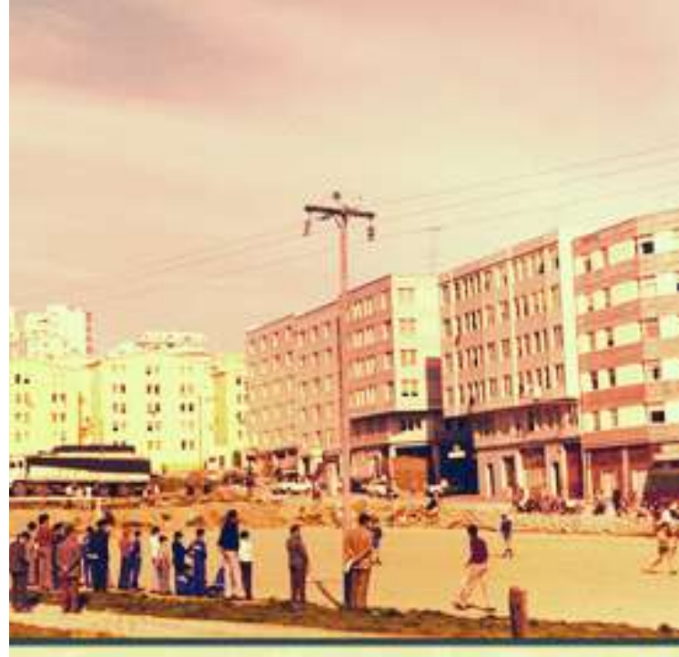
PARTIDO DE FÚTBOL NA ZONA DA RONDA

Moitos mesmo traballaban en dous ou tres traballos para poder dar de comer aos seus fillos.