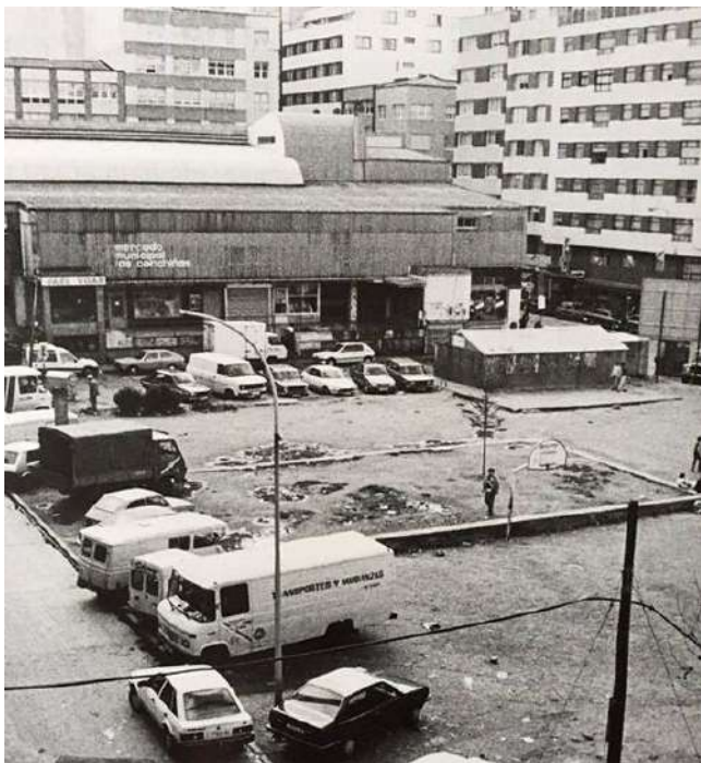
PLAZA DAS CONCHIÑAS

Lembra cantidade de anécdotas desa época, sobre todo a picaresca dos xitanos que dependían dunha paga condicionada á asistencia ás clases.