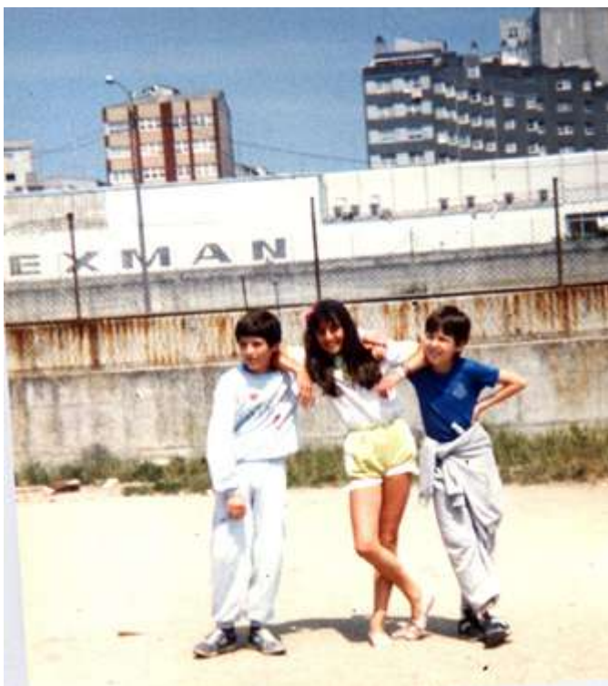
RAPACES NA ESCOLA SAGRADA FAMILIA ANOS 80

Hai edificios e baixos que están totalmente abandonados que afean o barrio e as tendas de ultramarinos foron cerrando. Non hai unha rúa peonil que sirva para conectar e unificar máis o barrio.