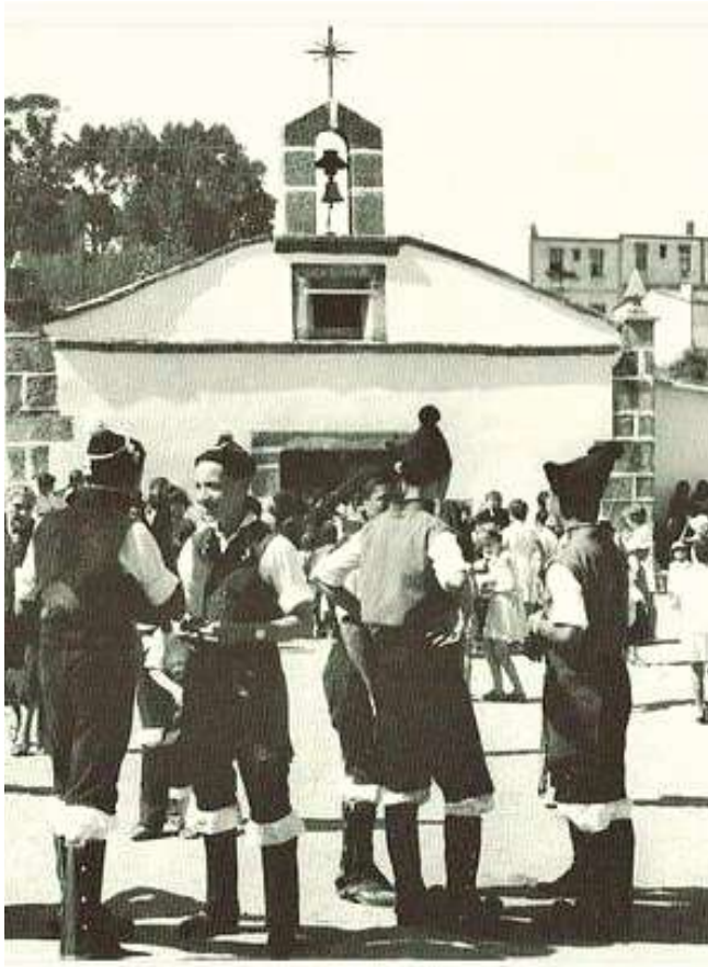
CAPELA STA. MARGARITA 1960

Ela empezou a traballar na súa tenda cando tiñan todo cerrado para edificar. Naquela época as familias estaban compostas de moitos membros: pais, fillos e avós. A edificación das torres reactivou o barrio.