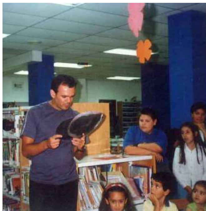
ACTIVIDADES DENTRO DA BIBLIOTECA ANOS 90

Nas festas de aniversario da biblioteca e entroido decorábase a biblioteca, facíanse contacontos, representacións teatrais ou bailes e en todas as actividades cooperaban os pais e nais e os nenos do barrio. Isto creou uns vínculos de proximidade entre a biblioteca e o barrio.