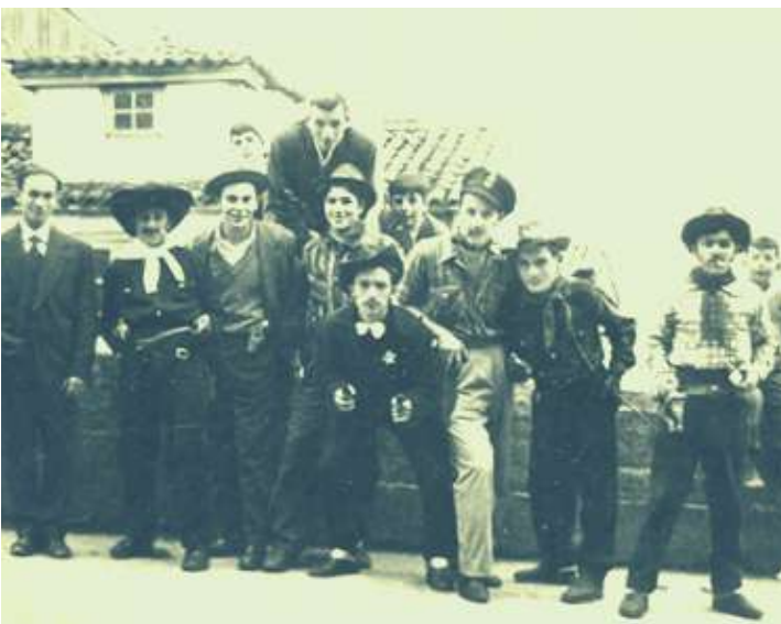
ENTROIDO AV. FINISTERRE ANOS 60

As festas máis celebradas no barrio eran o entroido e o San Xoán. No entroido os nenos e non tan nenos disfrazábanse e pedían polas casas. E no San Xoán facían lumeiradas, en principio onde estaban as torres. Normalmente facían dúas para competir entre elas. Non só asaban sardiñas, senón que tamén se cocían patacas e millo que traían das leiras de arredor.