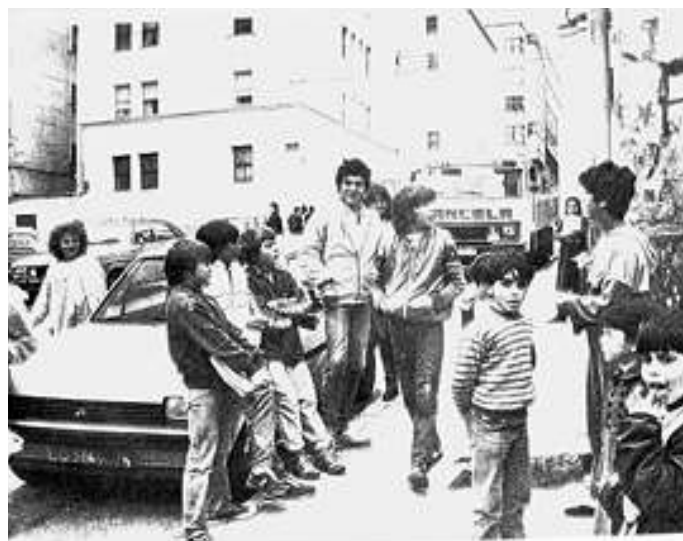
XENTE NA RÚA SAGRADA FAMILIA ANOS 60

Ela, ao ter un establecemento de comestíbeis, coñecía á maior parte da xente do barrio e mantiña moita comunicación con moitos deles.