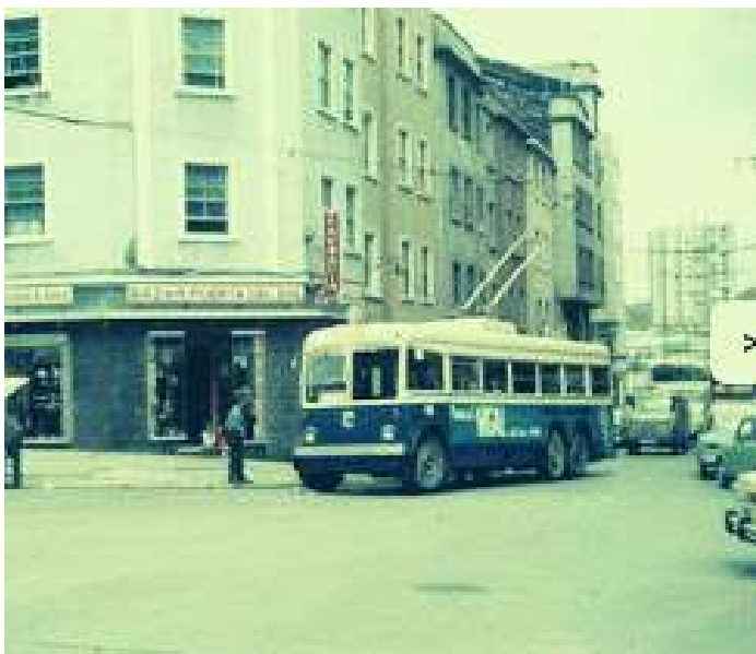
ANTIGO TROLEBÚS AV. DOS MALLOS

Lembra o túnel de entrada á biblioteca como un lugar onde os mozos facían as súas quedadas, moitas veces non só para compartir encontros senón para intercambiar substancias e beber alcol. Tamén a loita dos veciños e da biblioteca para converter ese espazo en privado e así favorecer a harmonía do barrio.