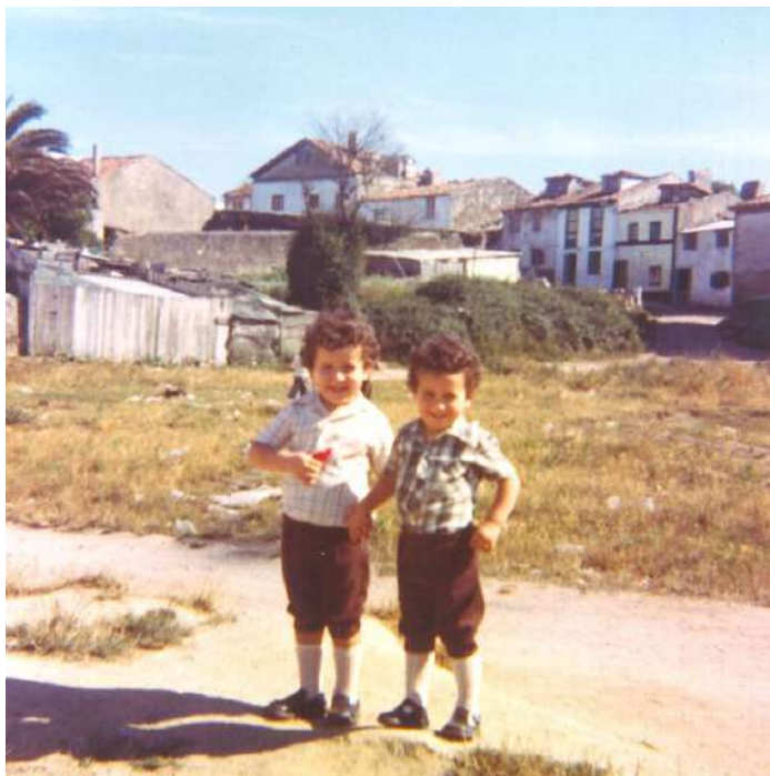
NENOS NO VIOÑO ANOS 70

Houbo unha mellora das instalacións e foi unha etapa de moita ilusión, traballo, colaboración social con outras entidades, loita para mellorar a seguridade do barrio e, sobre todo, leva consigo o cariño da xente e de nenos e nenas, que agora son xa maiores, e moitas familias coas que lle une un lazo que vai máis alá dunha relación laboral.