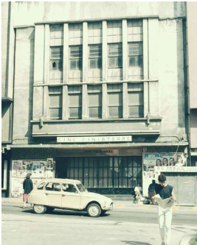
ANTIGO CINE FINISTERRE

Nesa época a maioría dos nenos estudaban estudos primarios e logo optaban por aprender un oficio. Era unha época difícil, onde a necesidade estaba antes que a formación.