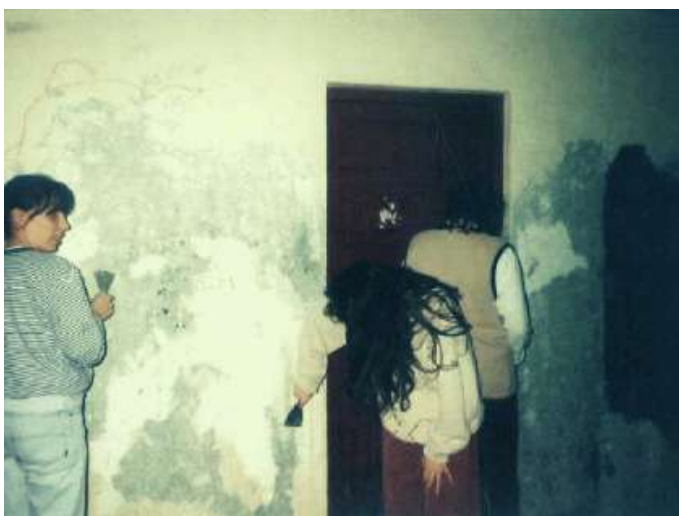
PINTANDO A PARTE EXTERIOR DA BIBLIOTECA ANOS 90

Era un lugar para estar, pasar o tempo lendo e tamén para facer os traballos escolares. Moitos nenos e nenas non tiñan espazo para facer os deberes nas súas casas, ou pasaban frío nelas, ou non tiñan un ambiente estábel. A biblioteca era unha alternativa á rúa, que acollía a nenos e nenas de familias desestruturadas, con problemas de drogadicción ou malos tratos.