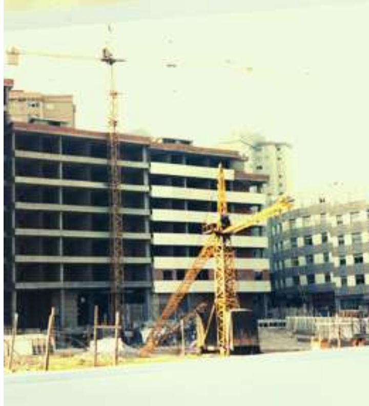
CONSTRUCCION NA PLAZA DE SAN ROSENDO ANOS 80

Naquela época o barrio contaba con carnizaría, barbaría, un bar que logo se converteu en local de alterne, supermercado, posto de verduras e de froita. Abrían os domingos nesa época. É dicir, había un comercio de proximidade que cubría as necesidades do barrio