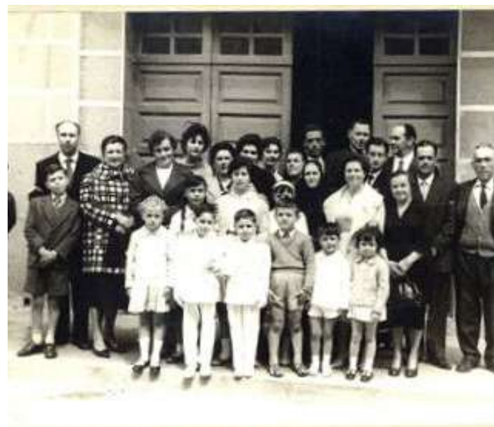
FOTO DE FAMILIA NO BARRIO ANOS 60

Nesa época había un bus que baixaba polo barrio e tiña a parada onde ata hai pouco estivo a cabina de teléfonos. Era estupendo porque o mantiña comunicado co resto da cidade..