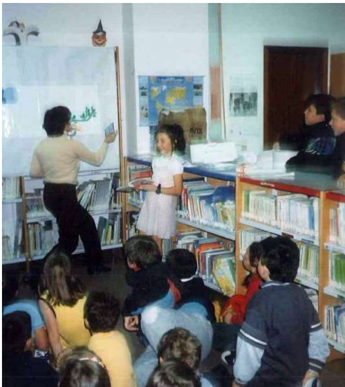
ACTIVIDADES DENTRO DA BIBLIOTECA ANOS 90

O Día das Letras Galegas prestábanse libros ao centro cívico e as bibliotecarias colaboraban na lectura de textos en galego.