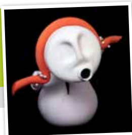
PREMIO FETÉN 2015, POLA SÚA EXPRESSIVIDADE