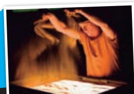
PREMIO FETÉN 2015, POLA SÚA ORIGINALIDADE, PRECISIÓN E MUSICALIDADE