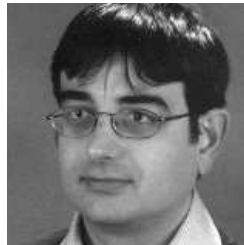
RAPSODIA HERNANDINA S. Quinto Serna

que encontramos música de cámara, música coral, música bandística y óperas. De estilo post-romántico, con Evocazioni nos presenta una obra evocativa e inquietante. La humanidad de los años 80 estaba amenazada por muchos peligros. Se oye el coral Aus Kiefer Not chrei ich zu dir (Desde la más profunda miseria clamo a ti) . Además en diversas ocasiones escuchamos el Dies Irae de la liturgia gregoriana como descripción de la catástrofe que se avecina. Al final, el propio Huber se auto-cita con un fragmento de su sinfonía Die nostrae aetatis angoribus (Desde el centro de nuestro tiempo) .