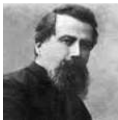
SINFONÍA PER BANDA A. Ponchielli

Amilcare Ponchielli (Italia, 1834-1886) fue organista y alumno del Conservatorio de Milán. Sus óperas gozaron de gran éxito entre ellas La Gioconda , cuya Danza de las Horas es más popular que la ópera en sí. Fue además