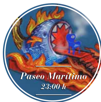
Paseo Marítimo 23:00 h