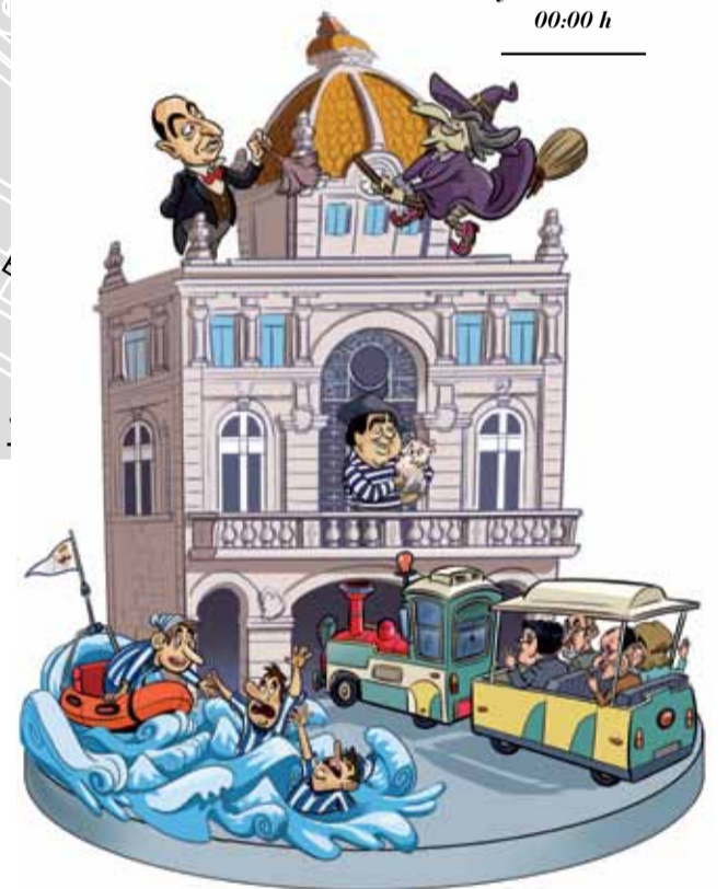
“La Falla, diseñada por Santy Gutiérrez, se podrá ver en la playa de Riazor desde el 20 de junio.”