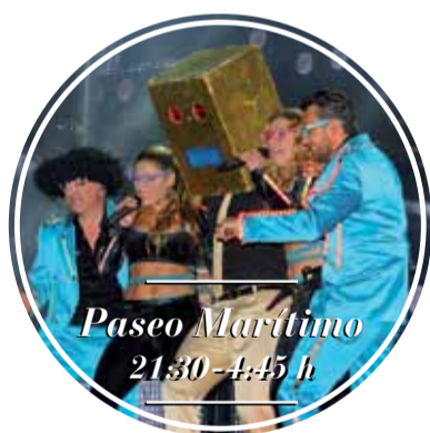
Paseo Marítimo 21:30 - 4:45 h