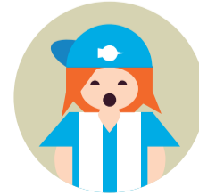
Sanjuanero forza Dépor