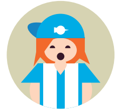
Sanjuanero forza Dépor