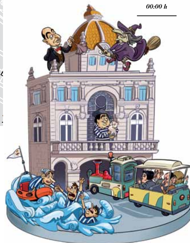
“A Falla, deseñada por Santy Gutiérrez, poderase ver na praia de Riazor desde o 20 de xuño.”