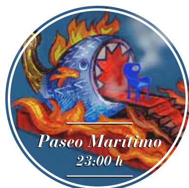
“O peixe e a cola de navío da carroza da Meiga Maior recordan a obra do pintor Urbano Lugrís.”