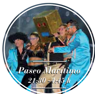
“Horas de verbena para animar a noite máis maravilhosa do mundo.”